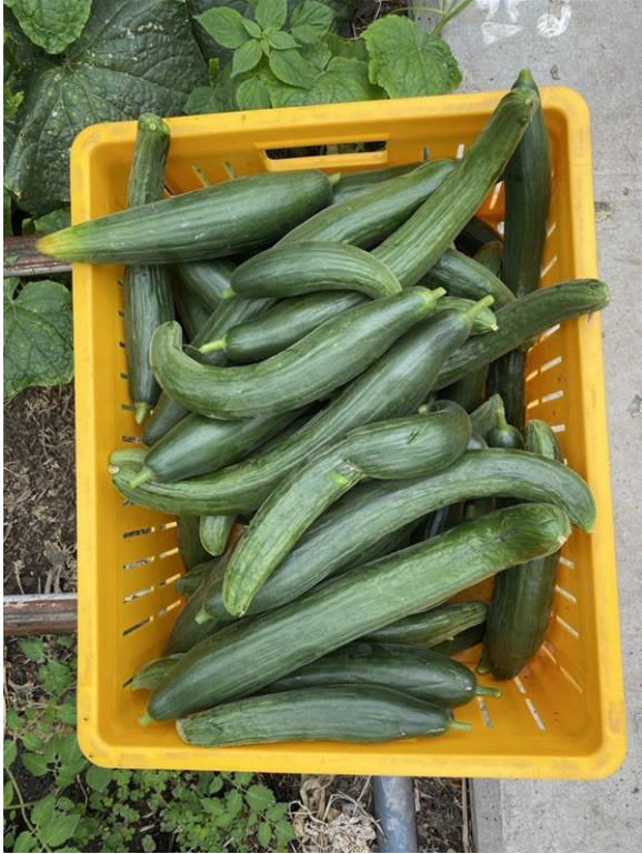
Bildtitel: Bio Gurken, die keiner Vermarktungsnorm entsprechen und in der Entsorgung landen.