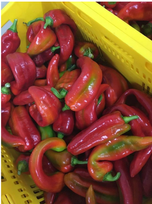
Bildtitel: Bio Spitzpaprika, welche auf Grund ihrer Farbe und Form nicht in den LEH gelangen.