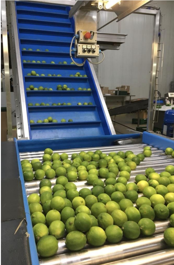
Bildtitel: Bio Limetten, gelb und grün – hoffentlich ist schon bald keine Sortierung mehr notwendig.